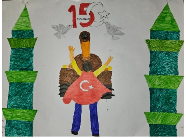
Orhan Efe BAKAR- 6/B

Adı Türk soyadı şehit Haine vermez geçit Ömerler çeşit çeşit Benim aziz milletim