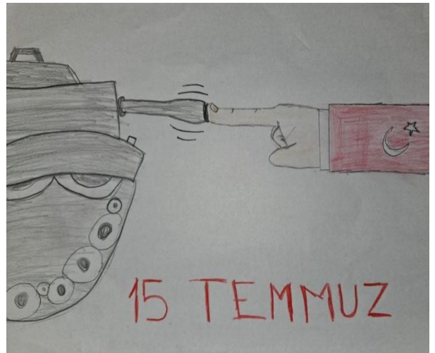
Yağmur ŞİMŞEK – 5/E