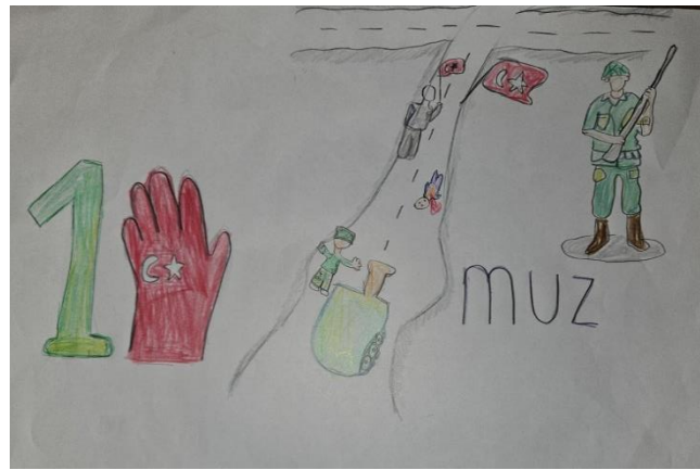
Filiz ABDULLAEV -7/C