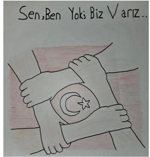
Yağız ÖNDE- 5/F