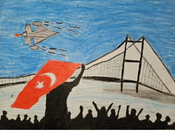
Sevim Ela ERDEM- 6/E